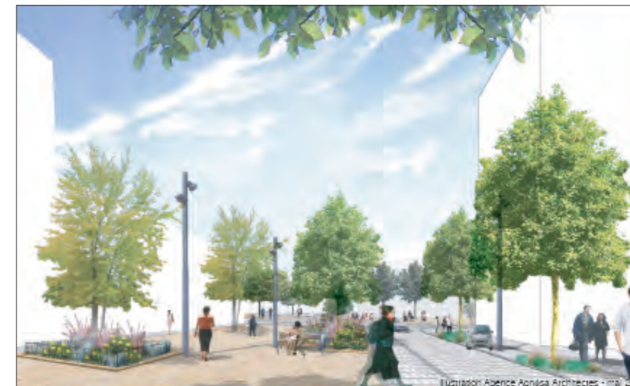
Vue de la future place du Traité de Rome.

L'omniprésence du végétal et des espaces paysagers sera donc l'une des caractéristiques fortes de ce nouveau cœur de quartier. Le concept de développement durable est également une priorité avec laquelle les