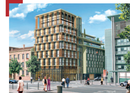
LOT A10d - Bâtiment Flying

De plus, le village de vente rue Clément Marot sera désinstallé en début d'année pour laisser place à l'emprise de chantier de démolitions.