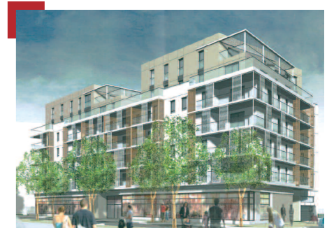
LOT A8a - Bâtiment Le Zénith

- Une réalisation de Flying : il s'agit d'un immeuble de bureaux qui propose une cafétéria en rez-de-chaussée. Ce bâtiment, en cours de finition, sera livré très prochainement (référence A10d sur plan en pages intérieures).